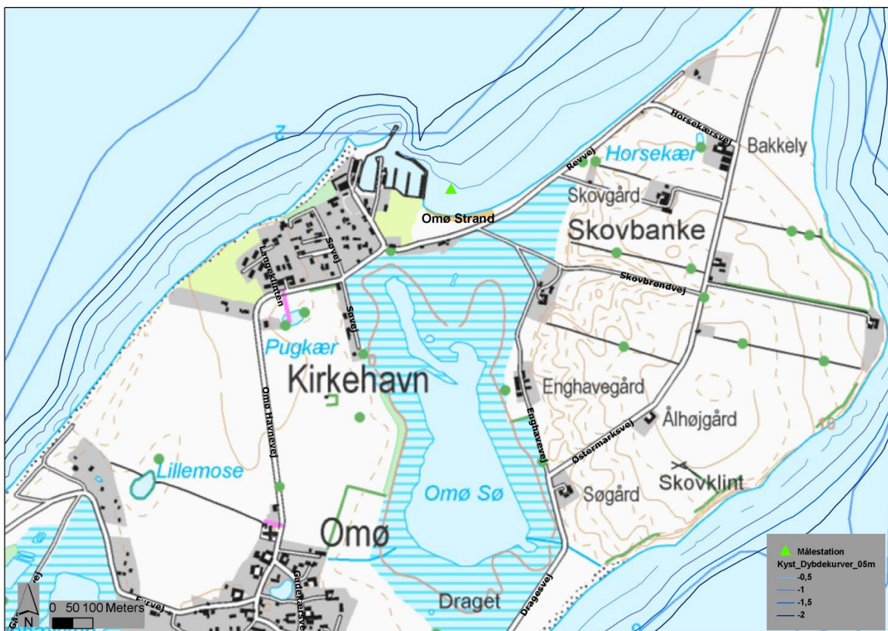
Figur 3. Omø Strand og det nære bagland.