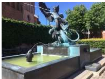
Skt. Mikael og Dragen