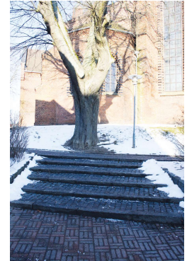
En anden type trappe som også fungerer fint sikkerhedsmæssigt.