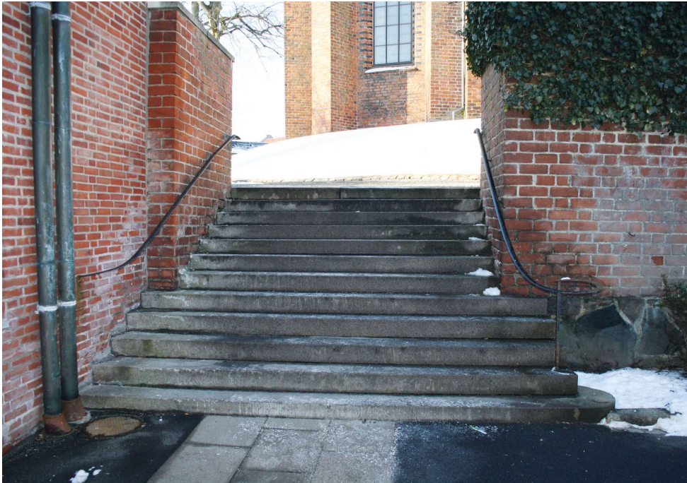
Eksempel på en fin velholdt trappe som hverken er glat eller har løse trappetrin. Gelænderet langs trappen er også i fin stand.