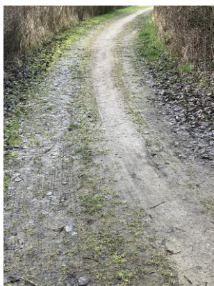
Eksempel på en niveau 4 sti, hvor græs og blade er på vej til at blive for dominerende.