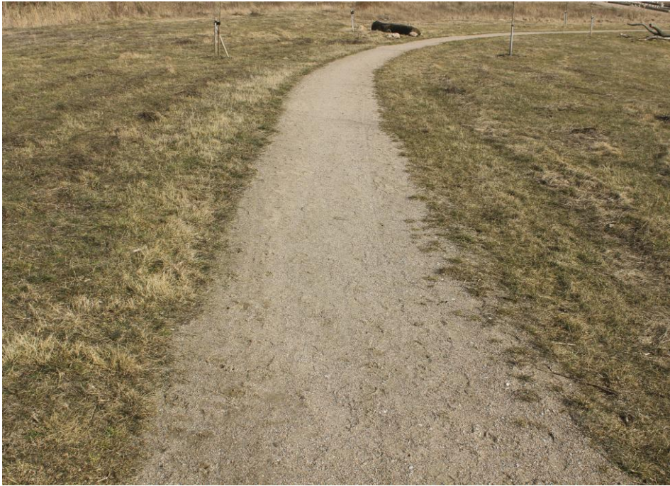
Fin, velholdt stenmelsbelægning i et naturområde.