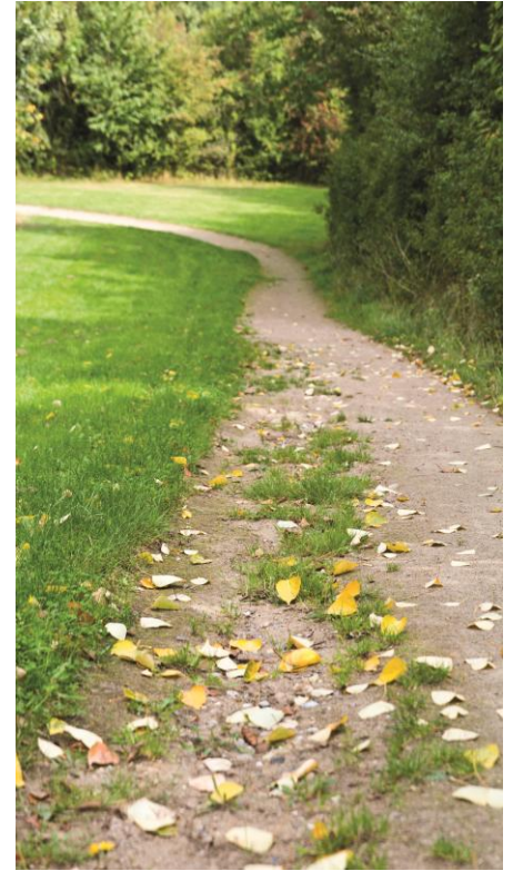
Stenmelsbelægning hvor ukrudtet er dominerende uden at være problematisk.