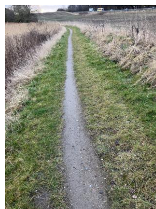
Niveau 4 sti, hvor græsset har taget for meget overhånd.