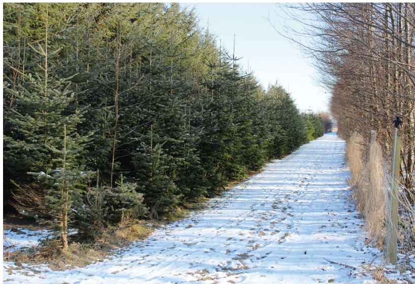
Skovsti med fin frirumsbeskæring og uden sikkerhedsmæssige risici.