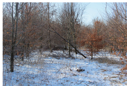
Hvis et træ som dette står i nærheden af en sti eller inventar, skal det trækkes ned, så der ikke længere er en sikkerhedsrisiko