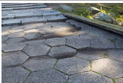
Uacceptable sætninger i flisebelægning.