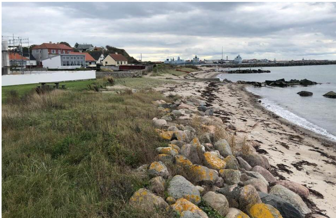
"Værftet", arealet hvorpå det nye digeanlæg skal etableres.

Der er således ikke behov for at tage hensyn til markfirben ift. hvornår man vælger at udføre de planlagte arbejder i forbindelse med digeanlægget.