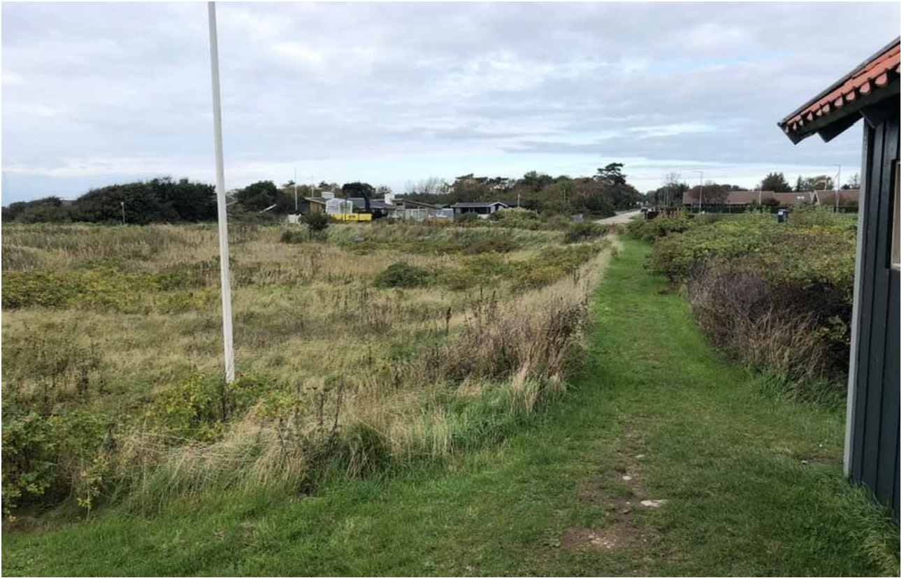
"Granskoven-Søbrinken" nordlige del, arealet hvor de nye digeanlæg skal etableres.