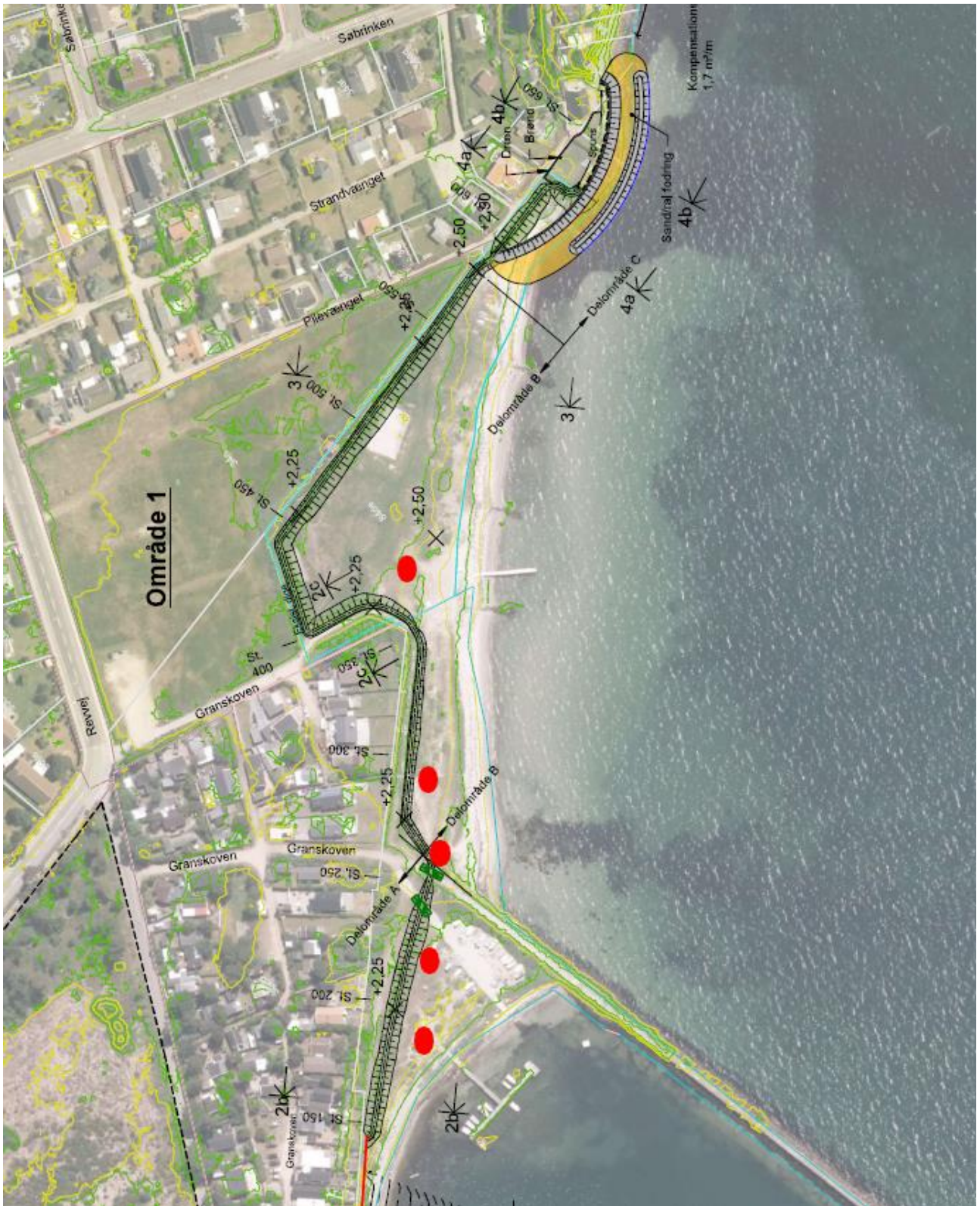
Granskoven-Søbrinken, fund af markfirben, august 2019.