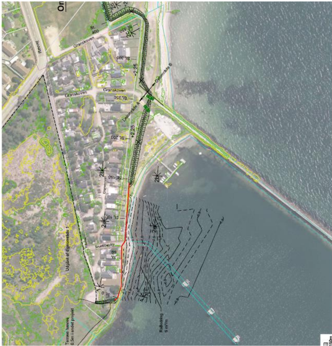
Diget ved Granskoven-Søbrinken: Nordlige del