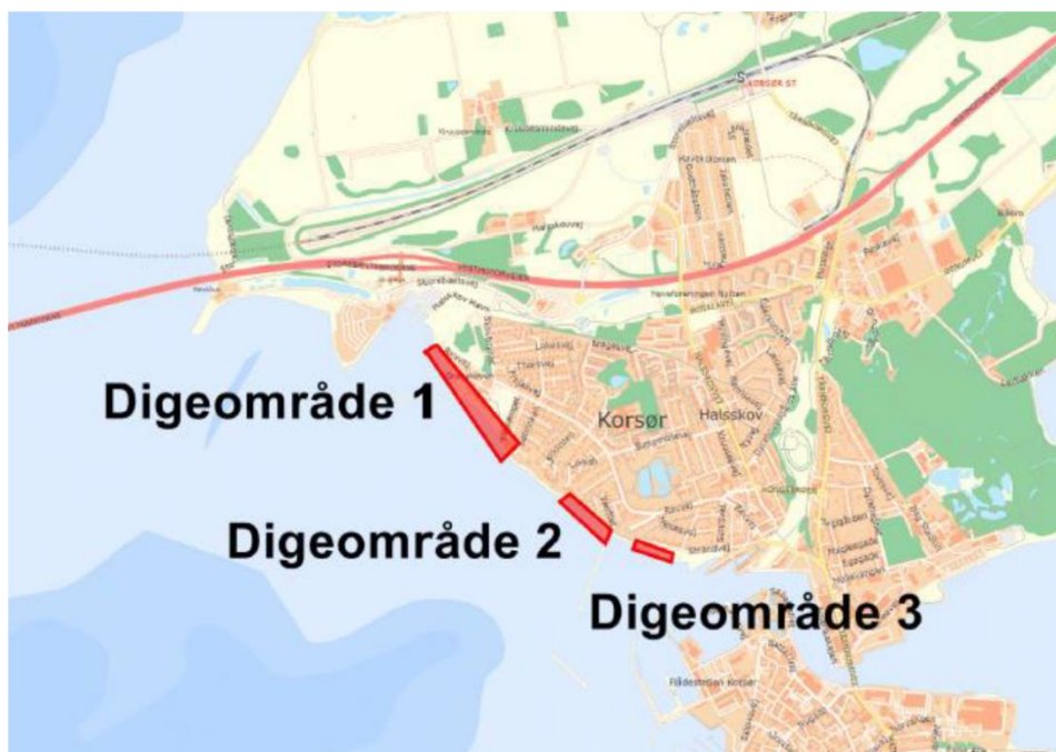
Figur 1.1: Oversigtskort over de 3 delstrækninger, hvor der skal etableres højvandsbeskyttelse.

Højvandsbeskyttelsesprojektet i denne væsentlighedsvurdering omfatter derfor 3 områder, som fremgår af Figur 1.1.