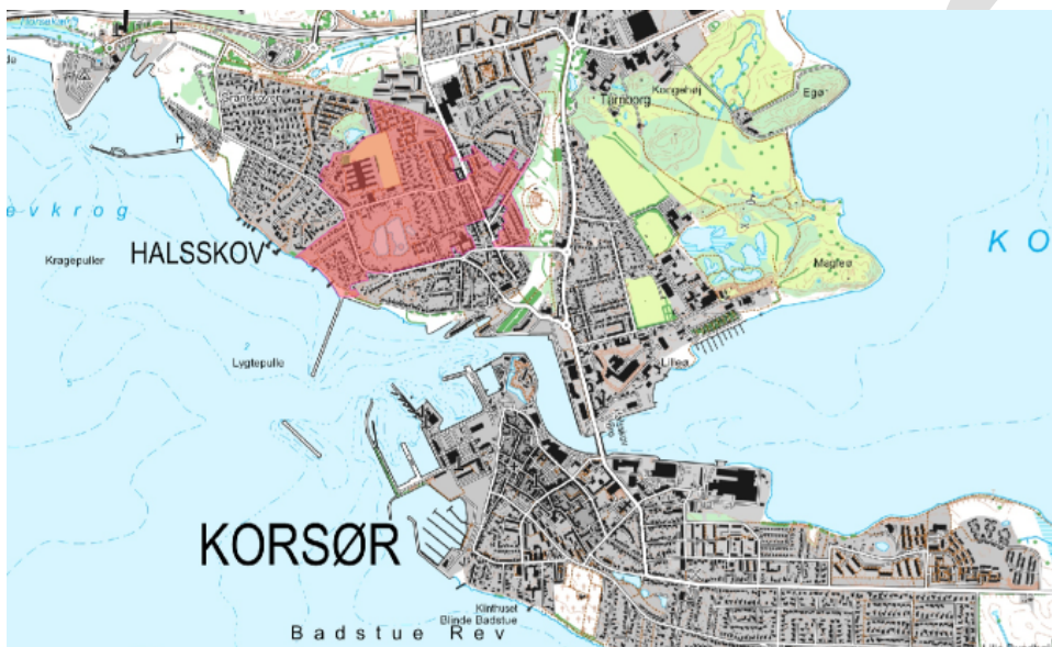
Figur 1 Rød markering viser det område som kystbeskyttelsen dækker.

Denne afgørelse omhandler højvandssikringen af Område 2, som hovedsagelig omfatter en fodring af stranden med ca. 14.000 m 3 sand således, at kystlinjen rykker ca. 15-20 meter søværts, samtidig med der etableres et dige og en mur på land med en topkote på +2,60 meter DVR90.