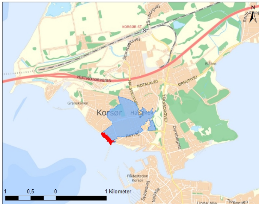
Figur 2 område 2 er vist med blå, kystsikringen er vist med rød markering.

Kystsikringen beskytter et 49 ha stort byområde, bestående af 727 ejendomme, kommunale arealer herunder veje og en række installationer, ejet af ledningsejere.