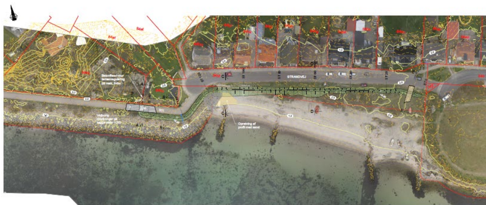
PLAN 1:500 Område 3

NOTE: Kortet er i anledning af udsættelse af Udvalgte del af 19 Rørledningsnettet af 17/10/20 Disseplanlægning udført af NIRAS 2019.05.11 Afstandene mellem kontakterne er 25 cm