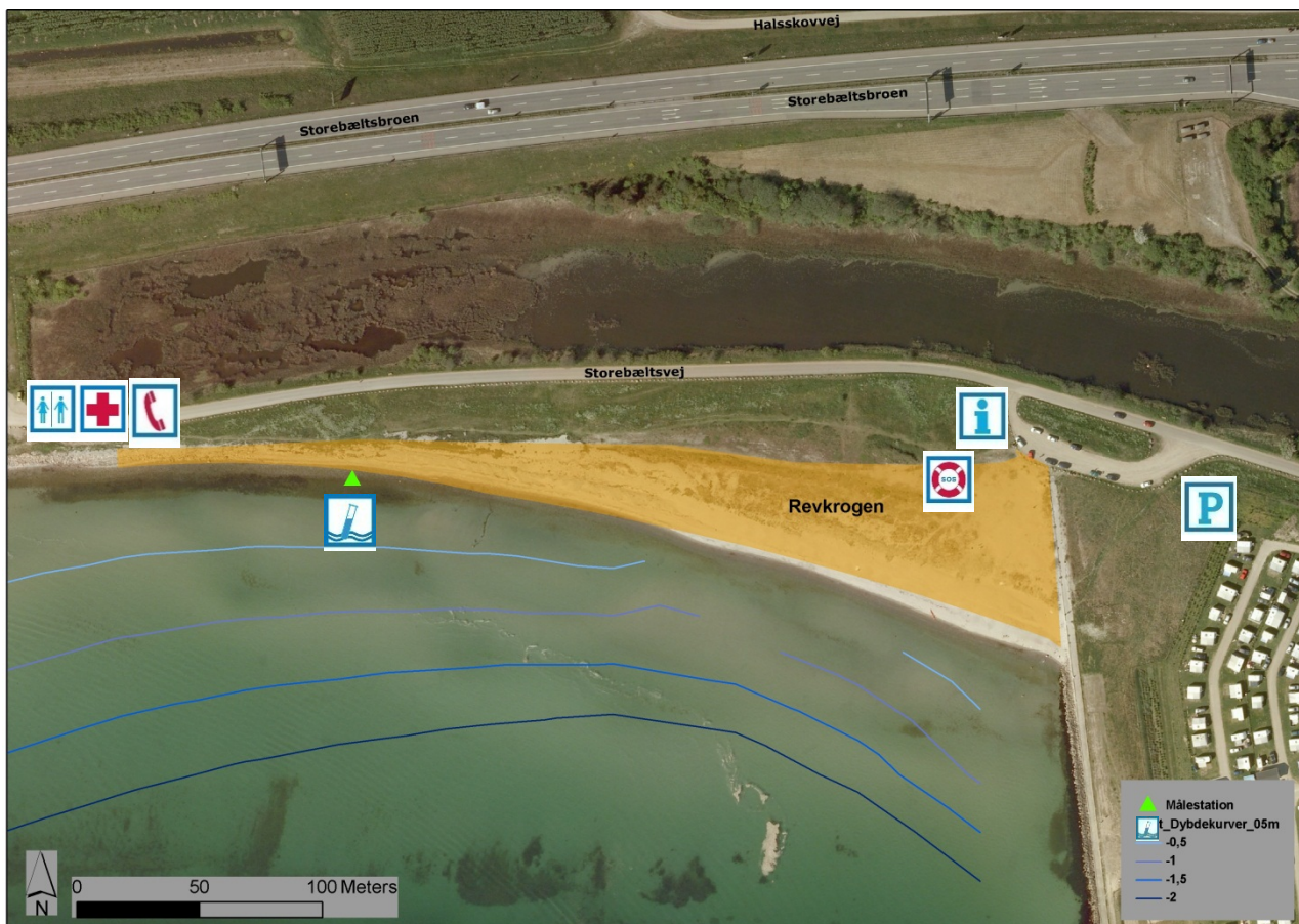
Figur 1. Revkrogen Strand med dybdekurver (0,5 til 2,0 meter).